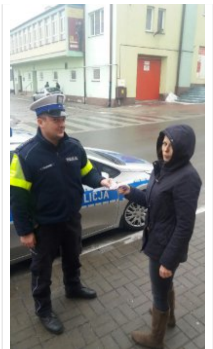
Policjant rozdaje odblaski