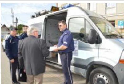
mobilny punkt informacyjny